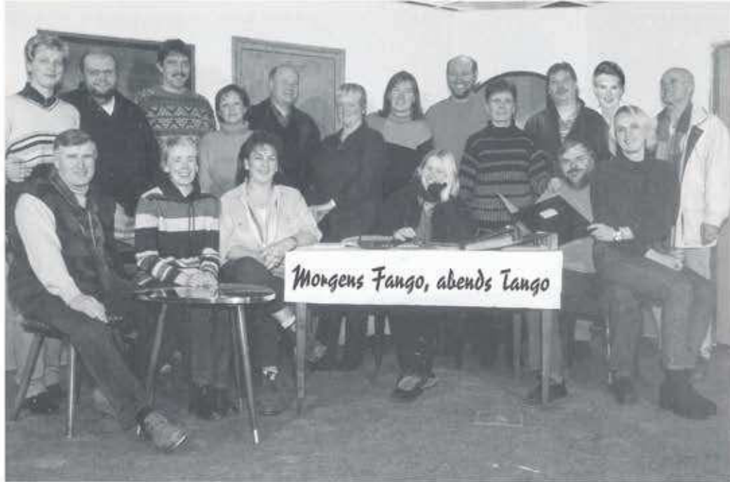
Die aktive Theatergruppe 2000